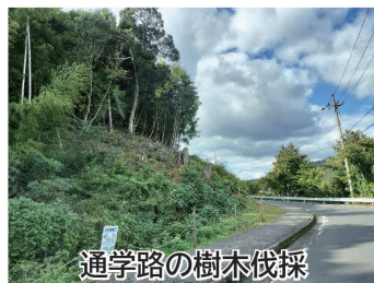
通学路の樹木伐採