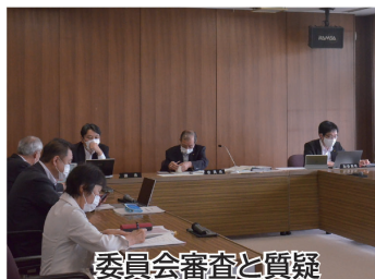
委員会審査と質疑