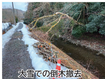
大雪での倒木撤去