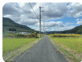
地域で共助の草刈り