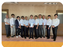
市長への要望活動

meemoをはじめ先進的な共助の取り組みが市内各所で始まりつつあります。交通・草刈り・雪かきなど求められている地域の課題に対して、引き続き皆様と共に解決に向け取り組んでまいります。