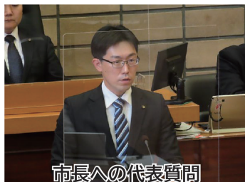
市長への代表質問

2020年 ICT 検討部会 部会長 (継続) 2022年 新政クラブ議員団 幹事