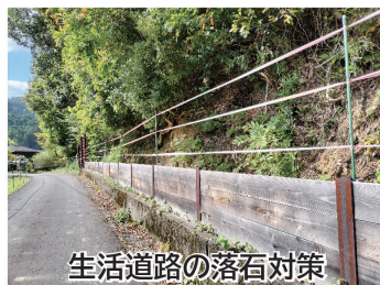
生活道路の落石対策