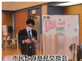
市民との意見交換会