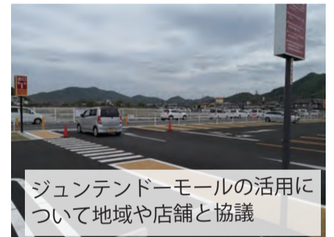
ジュンテンドーモールの活用について地域や店舗と協議