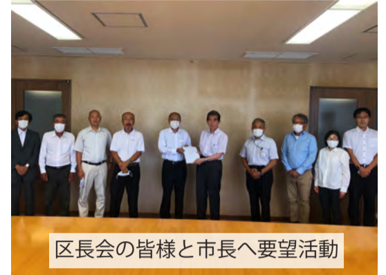
区長会の皆様と市長へ要望活動