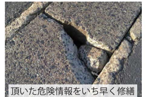
頂いた危険情報をいち早く修繕